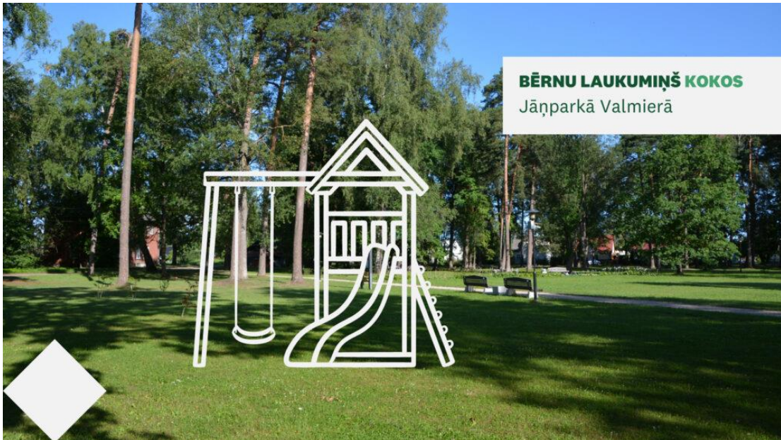
BĒRNU LAUKUMIŅŠ KOKOS Jāņparkā Valmierā