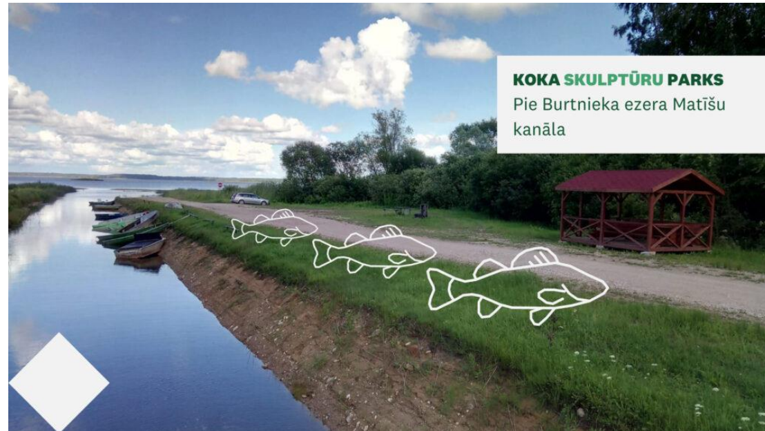
KOKA SKULPTŪRU PARKS Pie Burtnieka ezera Matīšu kanāla