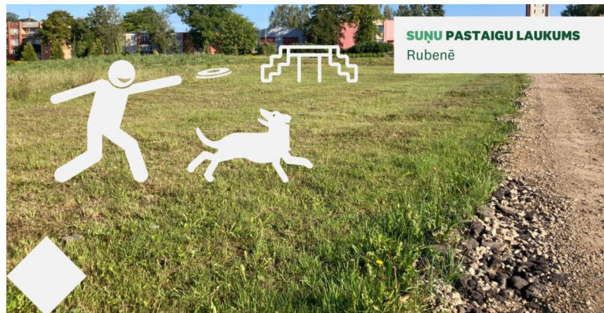
SUŅU PASTAIGU LAUKUMS Rubenē