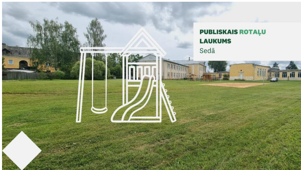
PUBLISKAIS ROTAĻU LAUKUMS Sedā