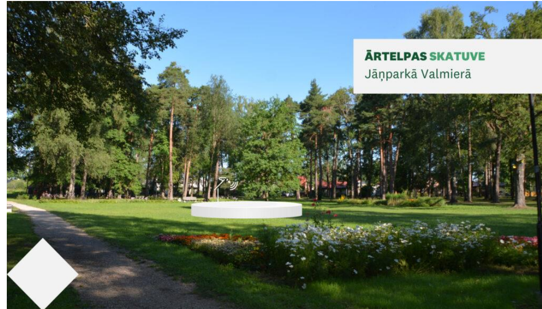
ĀRTELPAS SKATUVE Jāņparkā Valmierā