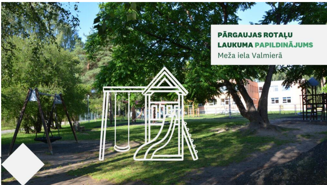
PĀRGAUJAS ROTAĻU LAUKUMA PAPILDINĀJUMS Meža iela Valmierā