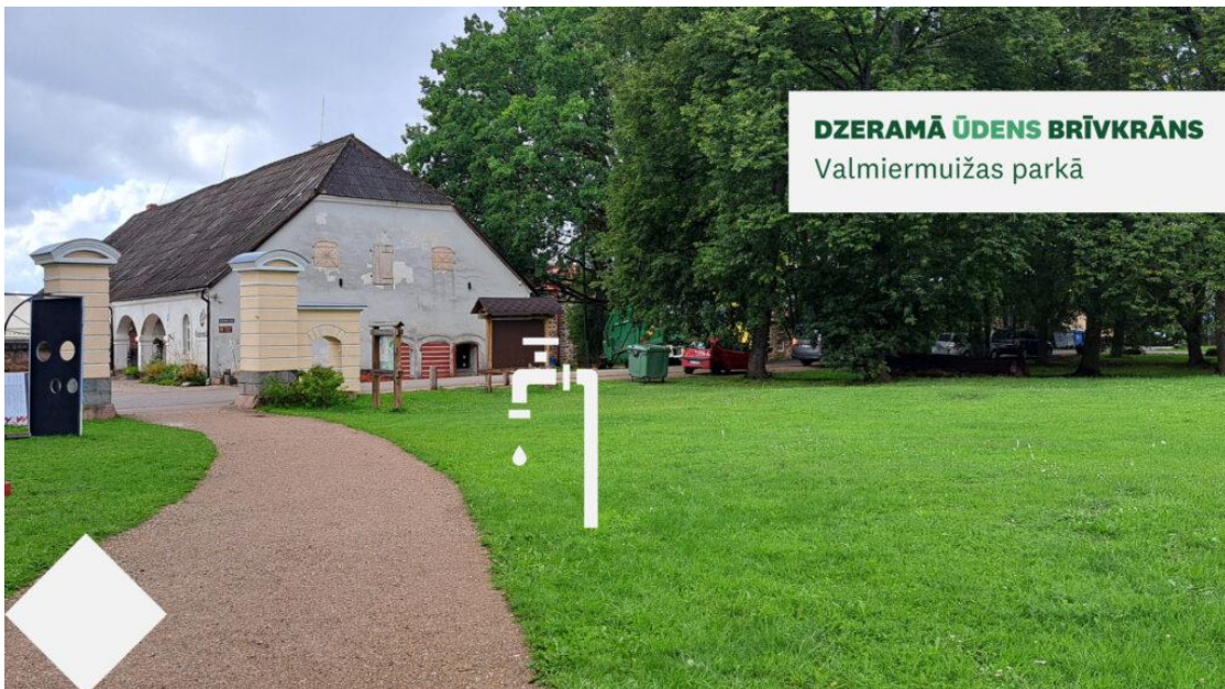
DZERAMĀ ŪDENS BRĪVKRĀNS Valmiermuižas parkā