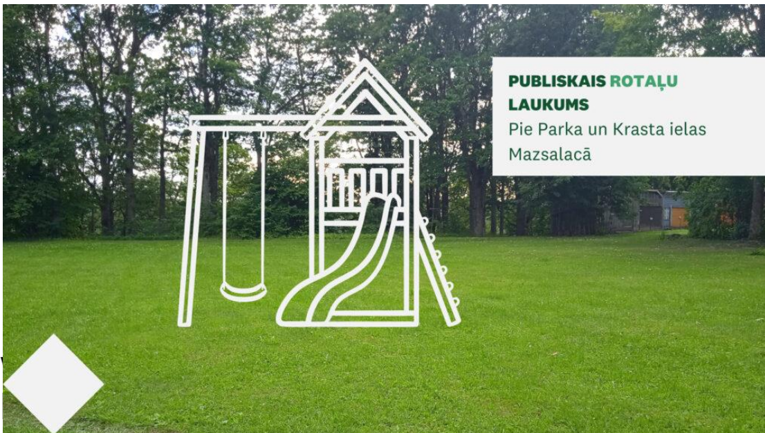
PUBLISKAIS ROTAĻU LAUKUMS Pie Parka un Krasta ielas Mazsalacā