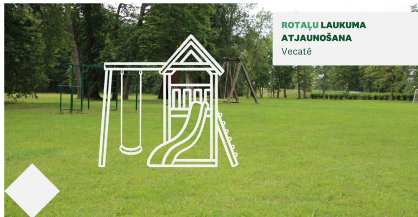
ROTAĻU LAUKUMA ATJAUNOŠANA Vecatē