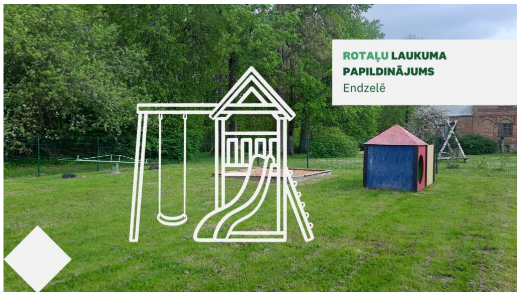
ROTAĻU LAUKUMA PĀPILDINĀJUMS Endzelē