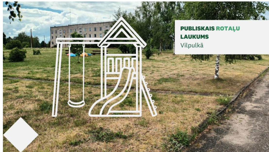
PUBLISKAIS ROTAĻU LAUKUMS Vilpulkā