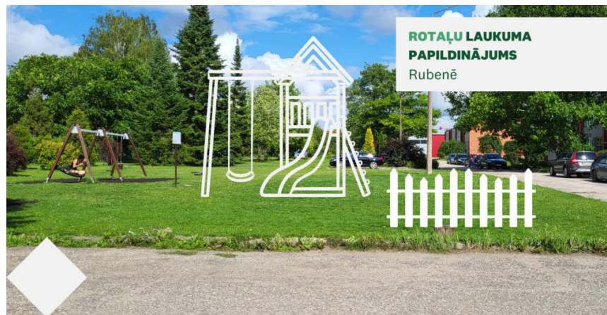
ROTAĻU LAUKUMA PĀPILDINĀJUMS Rubenē