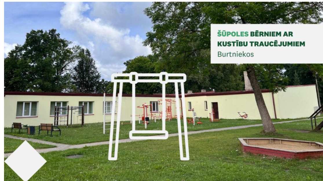
ŠŪPOLES BĒRNIEM AR KUSTĪBU TRAUCĒJUMIEM Burtniekos